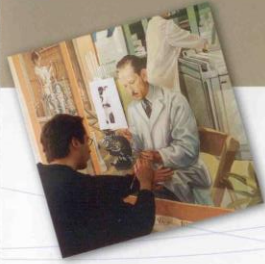
La Fresque de l'Hôtel-Dieu de Québec